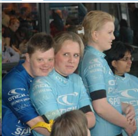
Spraakmaker 19 een uitgave van Zuidwester, verspreiding 11 november 2007, april 2007 Emotiewijzer Knoop in je zakdoek Zuidwester op koers