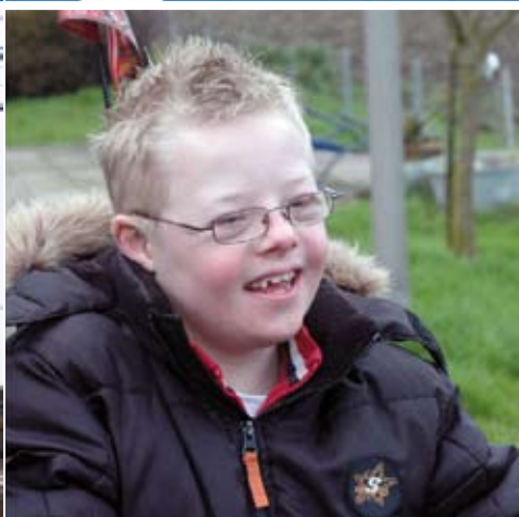
Spraakmaker 18 een uitgave van Zuidwester, verspreiding 11 november 2007, april 2007 Luc Kenter Verzuim in eigen regie Match4Care nieuwe stijl