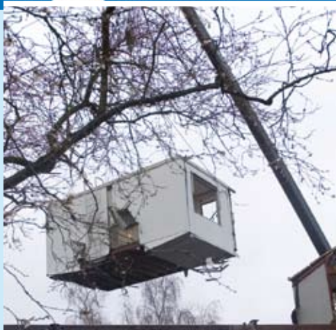
Spraakmaker 17 een uitgave van Zuidwester, verspreiding 11 november 2007, januari 2007 Herstructurering PMT gestart in Breda Wonen in Rotterdam-Noord