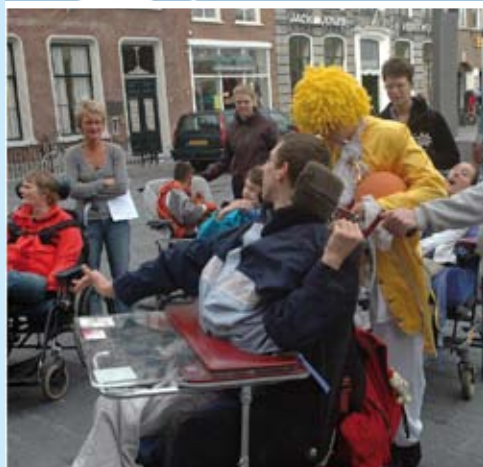
Spraakmaker 20 een uitgave van Zuidwester, verspreiding 11 november 2007, oktober 2007 Den Berg 45 jaar Zorgwaartepakket Welbespraakt Luc Kenter