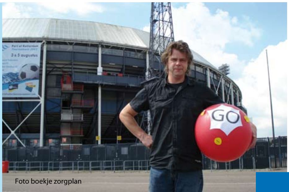
Foto boekje zorgplan

"Bij mijn vorige werkgever, een verpleeghuis, werkten we al met een rapportagesysteem via de computer. Ik was heel erg huiverig toen Zuidwester met Sikoob ging werken. Mijn ervaring was dat het meer tijd zou kosten, maar nu zie ik toch wel veel voordelen. Ik ben minder tijd kwijt aan de rapportage en alles staat veel overzichtelijker in de computer. Soms blijft het lastig dat je echt een computer nodig hebt om dingen op te zoeken. Ligt een cliënt in het ziekenhuis dan neem je de computer niet zo makkelijk mee."