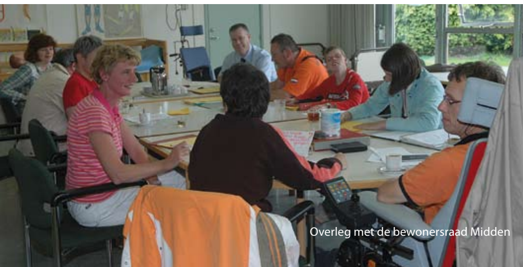
Overleg met de bewonersraad Midden

"Met elkaar staan we voor een moeilijke taak. Ik beseft dat deze periode van medewerkers veel inzet en flexibiliteit vraagt. Ik heb er echter alle vertrouwen in dat het met Zuidwester weer goed komt. Dit lukt alleen als we het samen doen en dat gebeurt gelukkig ook. Ik ben trots als ik zie hoe medewerkers