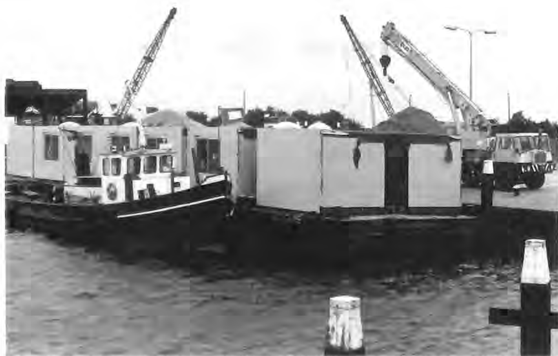
Het gereedkomen van het recreatie- en vakantiehuis in Oostvoorne was voor 'Hernesseroord' het hoogtepunt in 1981.

Ouders krijgen over het algemeen meer inzicht in de deelbegrotingen en in de besteding van gelden. Vooral in het werkvlak en dikwijls per leefgroep georganiseerd, is er een steeds toenemende belangstelling en echte participatie waar het het dagelijks leven en de problemen die daarmee samenhangen betreft, zoals het met elkaar omgaan, agressie en seksualiteit van bewoners.