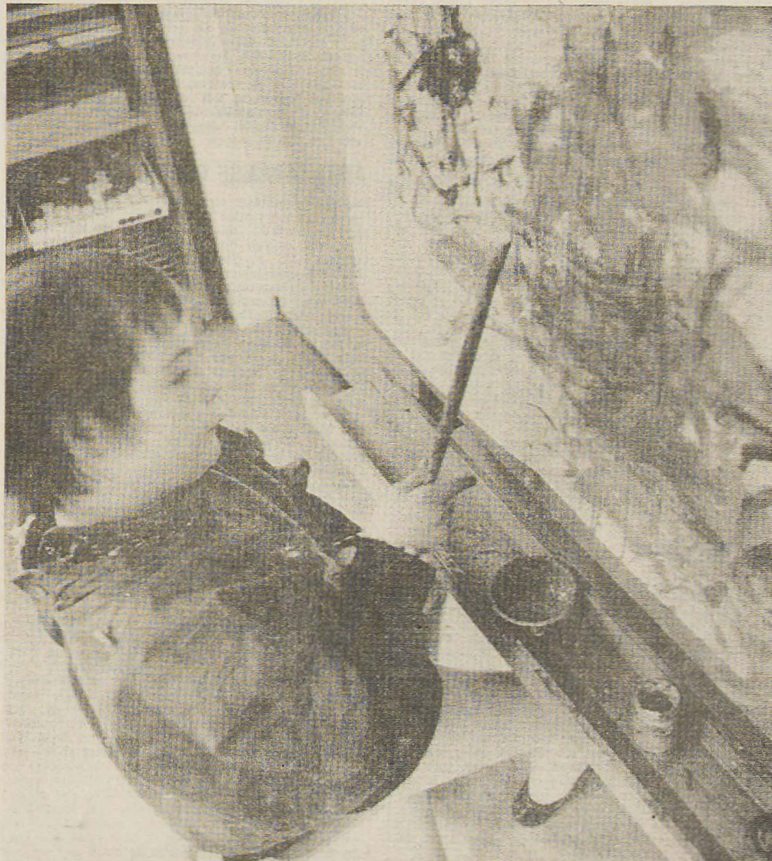
Eén min de pupillen in de lfenit'klas.