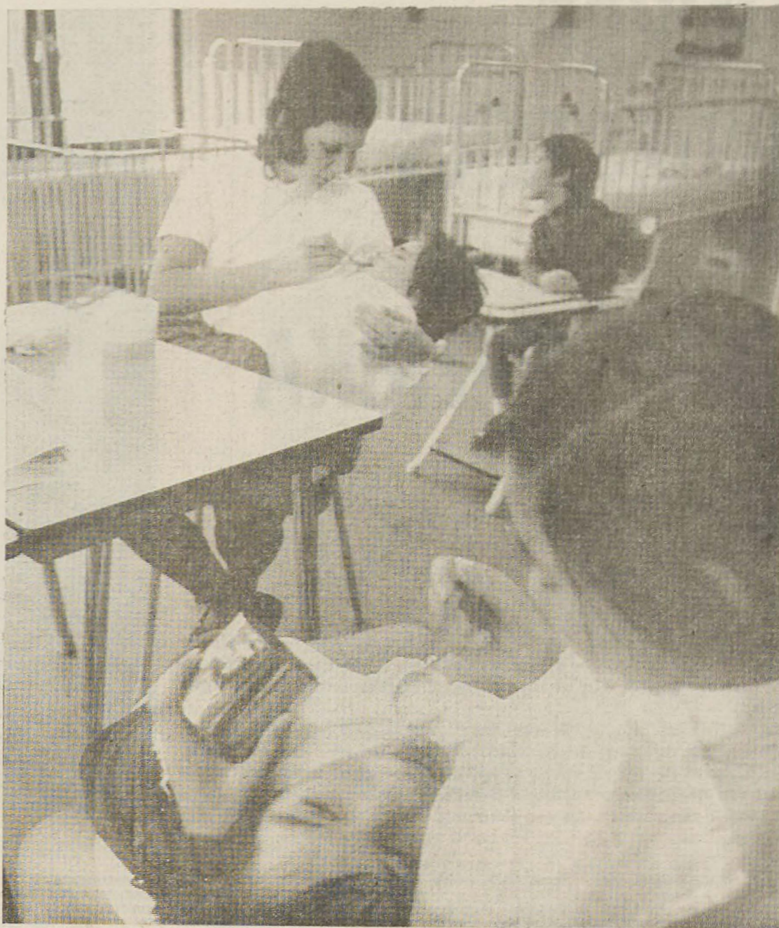
Eten: vaak drie kwartier per patiënt.

Het gebouw waarin gewerkt wordt, is uiterst onpraktisch. In verschillende bouwketen op het terrein spelen kinderen. In verbouwd huisjes wordt gepoogd een soort kleuterklasje na te bootsen. Een omgebouwd pakhuis doet dienst als gymzaal en arbeidstherapie-ruimte. De fy. siotherapeut ziet over enkele maanden een grote wens in vervulling aan. Hij knijgt een grotere ruimte toebedeeld. De Goese tandarts, die zich bereid verklaard heeft, de verpleegden van 'Den Berg' tandheelkundig te verzorgen, kan niet eens beschikken over een goede installatie. Binnenkort komt er ook een 9edagoog, maar waar die z'n werk-kamer zal krijgen, is voor de directie een groot vraagteken. Er wordt eimprovisieerd in 'Huize Den Berg' iag in dag uit, jaar na jaar. Maar remand, die precies weet, wat er m 'ue burcht' gebeurt.