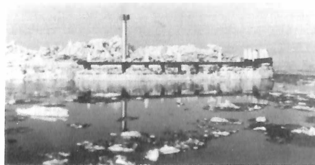
kruiend ijs op de pier van Middelharnis

onder normale omstandigheden een half uur duurde- koffie, soep (met name erwtensoep), gehaktballen, biefstuk en meer van zulk lekkers. Maar als het zo uitkwam stond hij ook wel eens aan het roer, verkocht desgewenst kaartjes en oliede de machine. Hij herinnert zich de torenhoge ijsschotsen uit de winter van 1962/1963: "er werd toen per dag maar één keer gevaren, daar had je een dag voor nodig", maar ook de geweldige stroom die er stond voor de haven van Middelharnis: "de boot vaarde altijd een eind de haven voorbij om er dan vervolgens goed in te kunnen steken". de stormen die hij meemaakte: "op het Haringvliet kon het behoorlijk spoken".